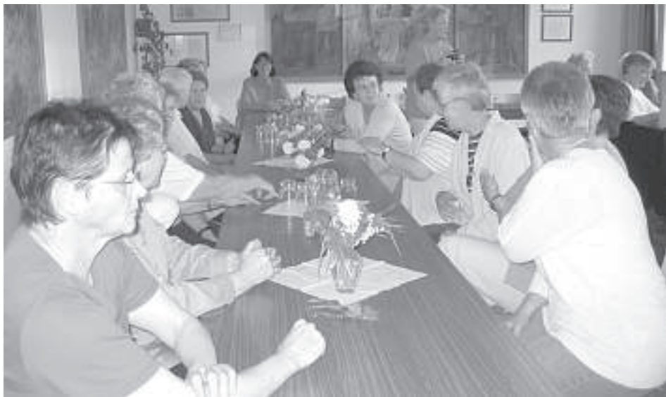
Wein, Weib und (Mai-)Gesang im Gemeindezentrum.