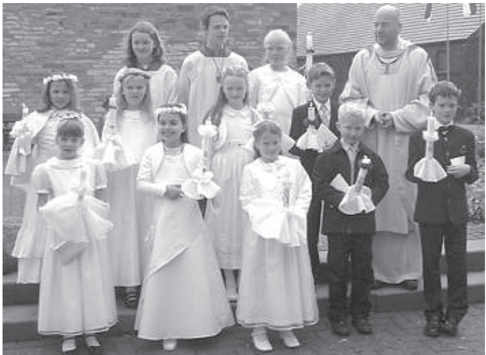
. . . den Kommunionkindern aus Bökenförde