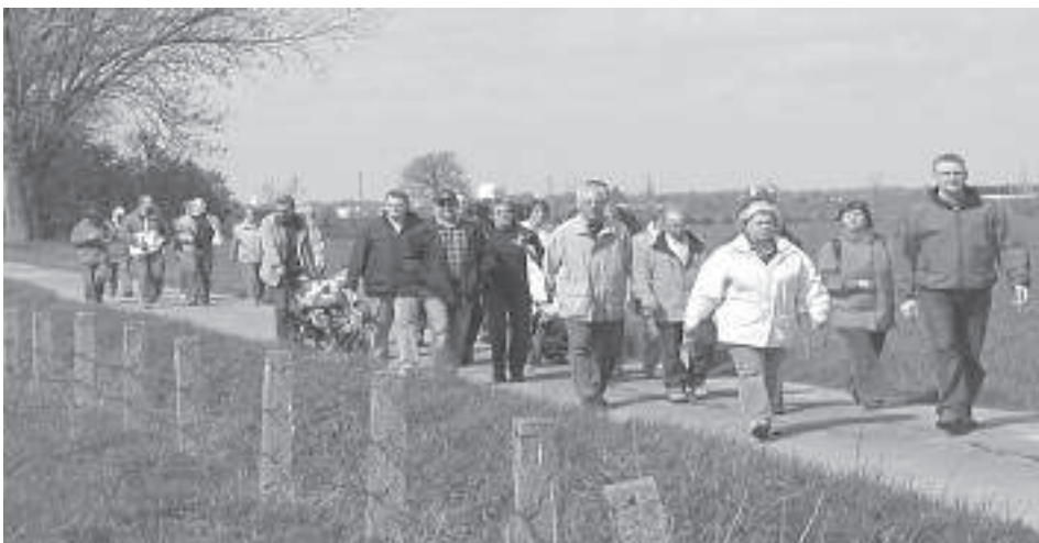
Jung und Alt auf Schusters Rappen durch die Bökenförder Feldflur

So traf man sich im Anschluss an die Osterliturgie an einem wärmenden Feuer, um sich ein gesegnetes Osterfest zu wünschen. Die ungezählte Christenschar muss wahrlich groß gewesen sein, da von den 250 Ostereiern und dem anscheinend nicht ganz so trockenem Rotwein nichts mehr übrig blieb. Text: Birgit Blumenröhre