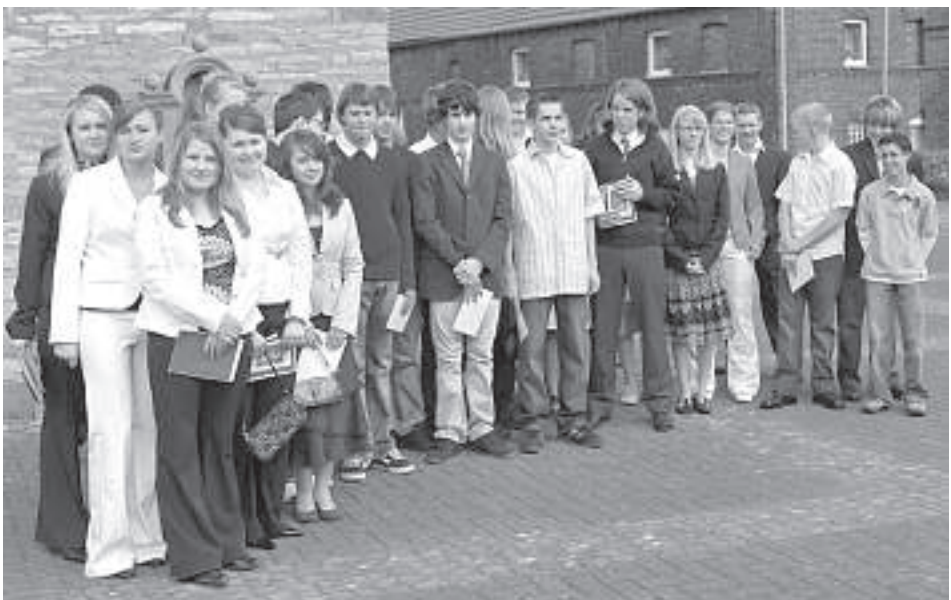
. . . den Firmlingen aus Bökenförde