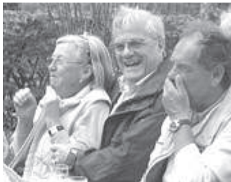
Sichtlich gutgelaunte Schnadgänger beim Abschließenden Grillen.

Überdas Gerstholz führte der Weg weiter bis in die Kirchensiedlung, wo ein Stein, der an unser 1000-jähriges Jubiläum erinnern soll, an der Jubiläumsbuche gesetzt wurde. Hier soll demnächst auch die von der Stadt Lippstadt geschenkte Bank aufgestellt werden. Von hier ging es weiter zum Gemeindezentrum, wo bereits die Bökenförder-Bauern-Bar auf die Schnadgänger wartete, um deren Durst zu stillen. Leckerein gab es vom großen Schwenkgrill, an dem jeder große oder kleine Hunger gestillt werden konnte. Auch für die Unterhaltung der jüngsten Schnadgänger war mit allerlei Spielen und einer Gocartrally gesorgt. Nachdem Dirk Ruholl die Sieger des Fragespiels während des Schnadgan-