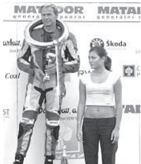
Siegerehrung: 3. Platz bei der Europameisterschaft in Most

So konnten wir die Erfahrung nicht machen, mit diesem Superracecart von 0 auf 100 in 2,3 Sekunden katapultiert zu werden, um dann von einer Geschwindigkeit von 100 km/h auf nur 18 Meter abzubremesen. Vielleicht war es ja auch gut so!