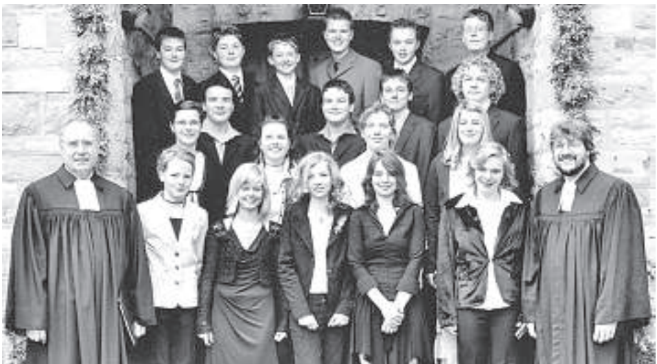
. . . den Konfirmanden aus Erwitte und Bökenförde